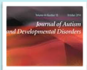
Journal of Autism and Developmental Disorders