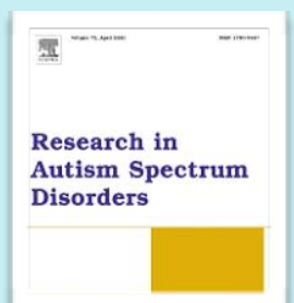
Research in Autism Spectrum Disorders